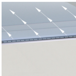
IMPULSIÓN DE AIRE EN ÁNGULO EN UNA DIRECCIÓN